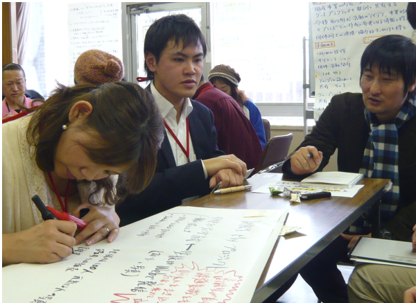
グループごとにアイデアを話し合う