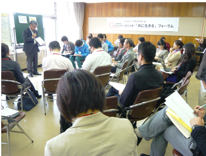
地域復興分野の共に生きるフォーラムの様子

なお、「共に生きる」ファンドは既に11次までの募集・助成を経て、現在第12次募集分の検討を行っています。次回13次応募期間は2013年5月を予定しています。JPF は引き続き、「共に生きる」ファンドの助成、助成団体の皆さまの交流を通じ、被災地の復興に向け、支援を継続していきます。